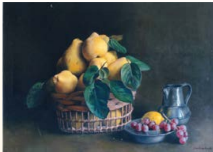
J'aime la vie

L'artiste a eu un véritable coup de cœur pour les fruits. Pêches, prune, cerise, coings... au gré des saisons et des envies... Ce sont d'ailleurs eux qu'il peint en tout premier lieu et qui annoncent le ton de la toile. Présents dans la plupart de ses œuvres, il leur donne un rendu velouté d'une pure sensualité, à l'instar du maître espagnol Francisco de Zurbarán, dont il revendique une certaine filiation. Il avoue bien volontiers qu'il peint lentement, à son rythme, il analyse les objets, côtoie la matière, savoure le temps qui passe en écoutant de la musique classique, une autre de ses passions.