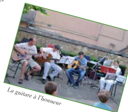
La guitare à l'honneur