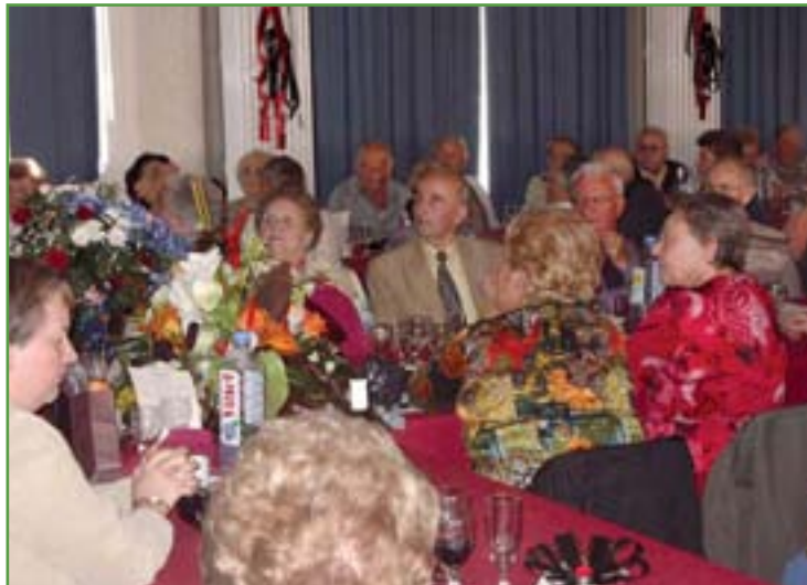
Un public attentif