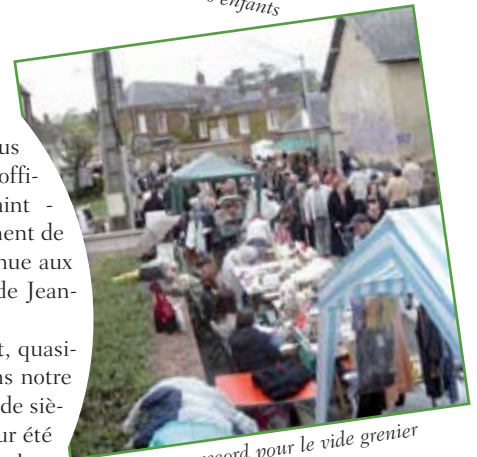
Ventes record pour le vide grenier de la Saint Georges