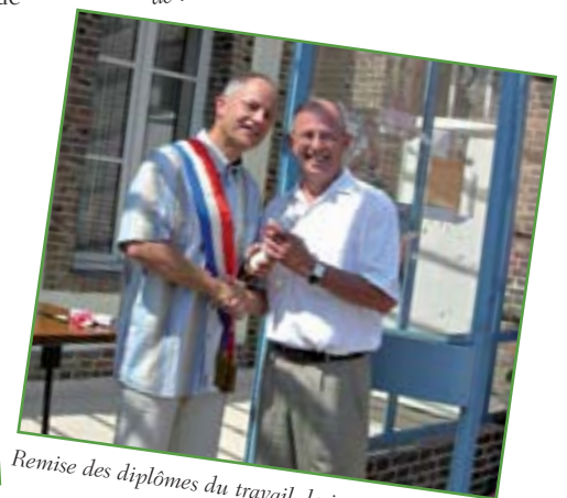
Remise des diplômes du travail, le jour du 14 juillet