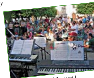
un public attentif