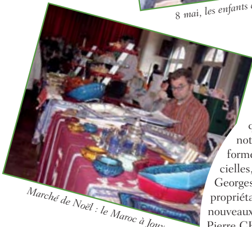
Marché de Noël : le Maroc à Jouy