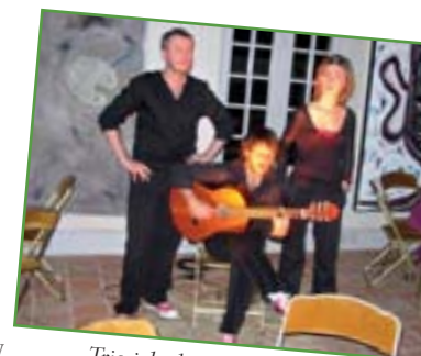
Trio job chante Brassens