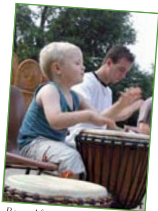
Repas Africain en juin au son du Djembé