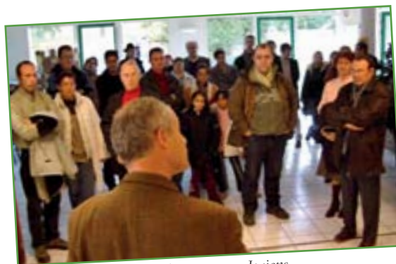
Accueil des nouveaux Joviens