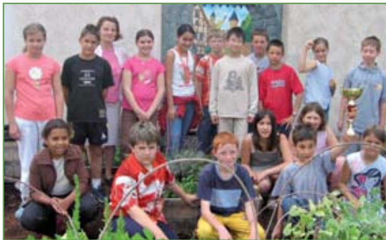
Le Rallye Math