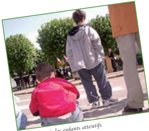
8 mai, les enfants attentifs